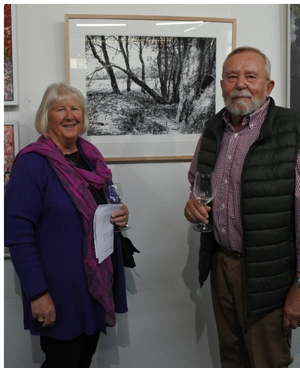
Juris un Inta, viesi no Adelaides – vai tiešām atbraukuši uz Pertu, tikai, lai apmeklētu izstādi?

Latviešu mākslinieku grupas izstāde notiek no 19. septembra līdz 3. oktobrim katru dienu izņemot pirmdienu un otrdienu.